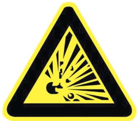
当心爆炸—爆炸性物质

关于这个方面,各消防重点单位应坚持以下四条理念。 1、现场灭火其实是一件复杂的事。从上面就可以看出,要考虑的东西相当的多,不但要求有技术能力,还要求有组织能力,而且这一切几乎是在无领导(有时候有领导也不起什么大的作用,指挥会相当地混乱)的情况下展开的,时间紧,任务多,压力大,所有临机处置事关生死存亡。火灾可以说是典型的突发紧急事件,对绝大多数员工来讲,真实的火灾发生时,他们都毫无经验可谈,是人生的第一次,紧张,慌乱,恐惧,听不到信息,忘记自己的任务,头脑一片空白,在前几分钟内失去大多数行动能力,等等。 2、员工的素质决定了灭火的成败。由于时间的极度紧张,在有限的时间内要做的事情太多,火灾第一现场前15分钟基本是自发的行动,指挥是相当困难的,也没有特别好的指挥方式(难道消防