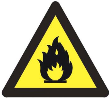
当心火灾—易燃物质