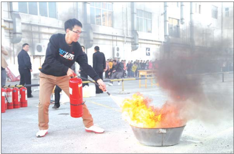
单位员工参加消防安全演练。

发生了火灾,但其他层尤其是上层人员根本不知道,知道时烟已封锁了楼梯,上层的人员死伤惨重)。打119,其目的是便于消防队尽快给予增援和帮助。 关于这一点,消防重点单位的管理层在平时就应该鼓励员工、并授权员工这样做。即使是再小的火灾,当员工这样做时都应该表扬,而不是责难。绝对不能在发生火灾时,还层层请示领导。 3、第一时间疏散。无论火灾大小,在扑救和报警的同时,立即组织顾客和员工疏散,尤其是优先疏散着火层以上顾客。死亡哪怕一人,其代价也是相当巨大的,决不能以财产损失和所谓的不良影响为决策的出发点。 4、第一时间采取辅助消防队灭火救人的其他措施。按照平时的演练和分工要