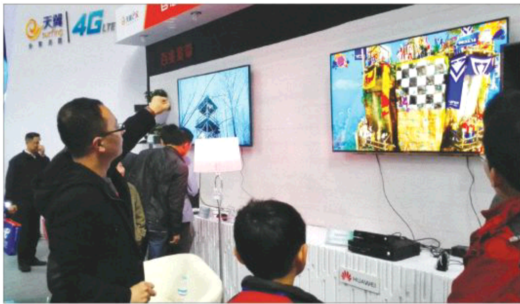
在山东济南,电信用户在体验百兆宽带支持的智慧家庭应用,一触即发的网速让用户欢呼“上网就是快”。

“以前看电视总是苦闷,我下班晚,总是错过喜欢看的电视剧,连新闻联播都赶不上,真是头疼。自从升级了电信宽带100M业务以后,通过iTV,回家想看什么就看什么,现在热播的电视剧《虎妈猫爸》一集不落