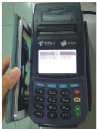
图为电信NFC手机钱包客户端用户在现场消费。

今年“两会”期间,李克强总理在政府工作报告中提出实施“互联网+”行动计划,并第一次提出把一批新兴产业培育成主导产业,推动移动互联网、云计算、大数据、物联网等与现代制造业结合,促进电子商务、工业互联网和互联网金融健康发展,引导互联网企业拓展国际市场。本月13日,中国电信集团公司(以下简称“中国电信”)在北京发布“互联网+”行动白皮书,并与合作伙伴及重要客户签署合作协议,共同打造“互联网+”产业生态