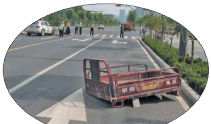
三轮摩托被撞解体。