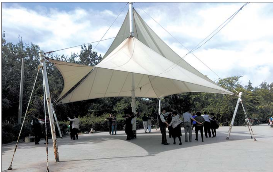
市民们在绿地广场跳舞

应广大市民需求,2015年市园林局坚持“以人为本、绿化便民利民”的原则,实施了城区公共绿地便民改造提升工程,因地制宜,对城区20余处绿地进行原有设施修缮;便民广场、游步道铺装,设置休闲健身设施,对绿化区域进行绿化提升,使公共绿地的功能性和景观性得到提升,涉及绿化面积1万平方米。