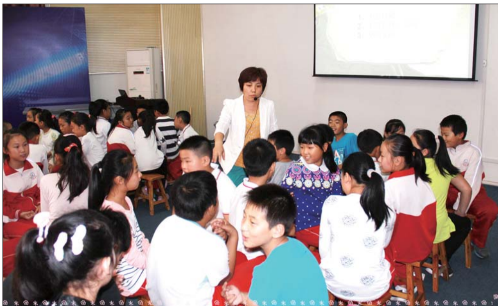
班级议事会师生都是主体。

立人先立德，成才先成人。德育处于学校教育工作的核心地位。“育人比教书重要，体验比说教重要”，这句话不仅说明了德育的重要，也指出了德育的方法。传统的德育模式常常表现为“老师说，学生听”的说教式。这种模式下，学生是被动地接受道德教育，往往缺乏效果。章丘市道通实验学校自2011年建校以来，一直站在基础教育改革的前沿，突破和超越传统办学模式，把特色办学作为学校发展腾飞的内驱力，努力为学生创造“适合学生、适合社会、适合未来”的“三适”教育，大力实施“体验式德育”，使学校成为一所有特色的示范名校。