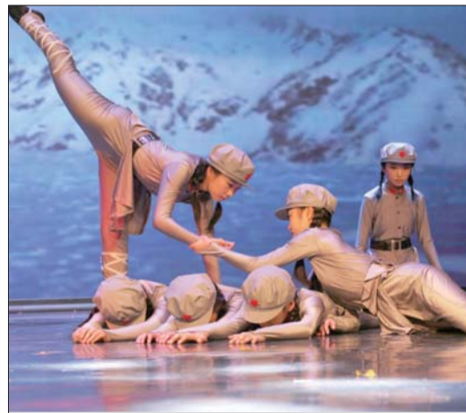
让每个学生都有出彩的机会。

春风化雨，润物无声。“体验式德育”以其立足于实际的教育方式，在实践中培养人、塑造人，以更适合自己的教育方式，让德育全面渗透于学生学习和生活的各个方面，在潜移默化中，让学生受到熏陶，得到教育，培养适合社会、适应未来的高品质人才。