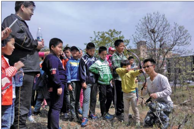
教练正在教小记者射箭。

看上去是一支简单的弓和箭,但真正操作起来难度可不小。有的小记者天赋秉然,不仅拉弓的姿势很到位,而且射中靶子的几率也很高,而更多的小记者是在摸索中前进。一上午的体验,家长和小记者亲近大自然,零距离感受射箭技术带来的特殊魅力。