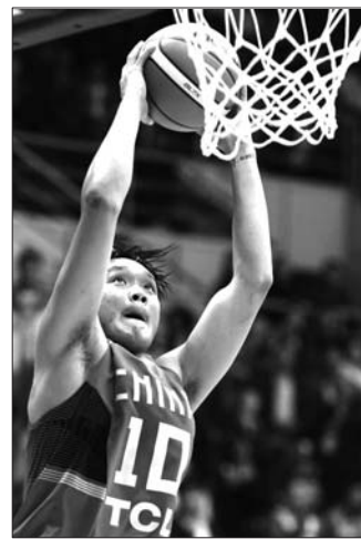
小丁在国家队迎来出场机会。

目前,第三届全国智运会的第一次报名工作已结束,据统计,将会有来自全国31个省、自治区、直辖市,5个计划单列市,11个行业体协以及澳门地区总计48个单位参加本次比赛。其中,运动员2300多人,领队教练470多人,参赛总规模超过3200人,较上一届基本持平。