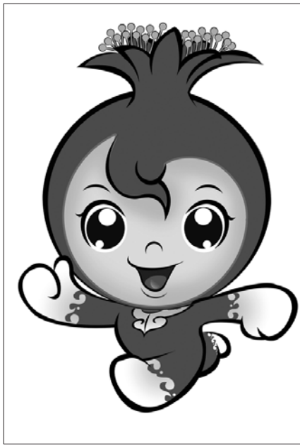
►第三届全国智运会吉祥物棋棋