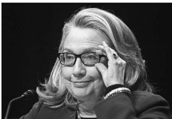
美国前国务卿希拉里

件,均为与美国驻班加西领事馆遇袭有关的内容。邮件中的部分内容在撰写时并非保密信息,但现在已被美国联邦调查局“调整”为保密信息。美国国务院发言人哈夫22日说,按照保密要求,这批被公开的邮件中共有23个单词被屏蔽。据美联社报道,美领馆遇袭后,曾有多名嫌疑人被捕,而被屏蔽的邮件内容涉及提供举报线索的“线人”。另外,美国国务院曾把这些信息标注为“外籍禁阅”,意指该内容不允许