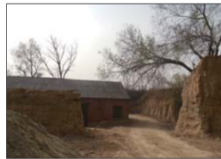
华不注山脚下的弹药库遗存。

15年沉淀,这本《济南第一名山——华不注》终于面世了,新华书店已经上架。这样的书不会畅销,只能靠自费出版。虽然我并不富裕,但是能够给华不注山写成一部山志流传于世,也算是我为华不注山的复兴,贡献出一点绵薄