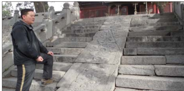
华不注山脚下的弹药库遗存。

华山有明确文字记载的历史达2600多年,这在济南,乃至山东都是不多见的。华山这个地方在春秋的时候,属于齐国。齐国是春秋第一个称霸的诸侯国,可很少有人知道,齐国在军事上的衰败就是从咱济南的华不注山开始的。