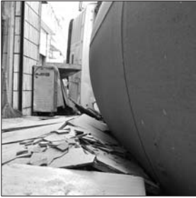
搅拌罐轧碎门前砖,只差几十厘米就轧到店面墙体。

惊魂未定的商砼车司机说,他知道路东边有暗沟不结实,专门顺着西边倒车进胡同,车轮轧到了暗沟边缘,轧塌了本来就不太结实沟边石头和楼板。出事时,施工方一名女工站在商砼车上用木棍帮忙挑开半