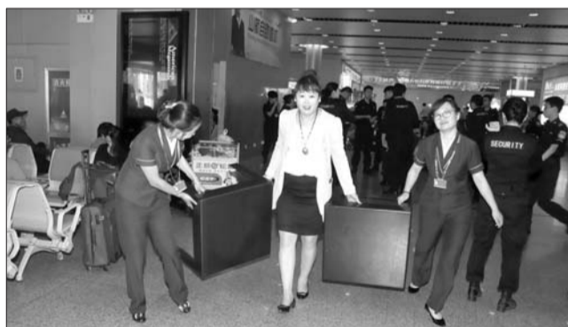
27日,莱山国际机场工作人员搬运办公用品。

本报5月27日讯(记者 李大鹏) 机场转场,没有搬家的喧闹,而是静悄悄地进行。为了使此次机场转场工作安全顺利地顺利完成,烟台福海搬家物流公司提前一个月便对路线进行了考察。搬家当天,员工们统一着装,悄悄忙碌着,没有让莱山国际机场的乘客受到影响。 烟台福海搬家物流公司总经理左海年介绍,公司承担了此次搬迁的大部分工程。“七八十辆汽车,得拉两次,这次一共200多个工人参与搬家。”左海年说,这是他们参与的距离最远的一次搬家。之前火车站搬家也是他们负责,那时候动用了二三十辆车。 左海年说,除了保证新机场正常运行外,还要让老机场正常运转,让乘客们正常乘机,感受不到搬家带来的影响。公司专门组织员工统一着装,保持低调。在机场里运走一些大型设备需要动用吊车,他们就把设备拉到很偏的