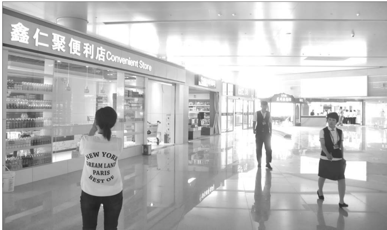
27日,蓬莱国际机场内的商家已经做好了开业的准备。