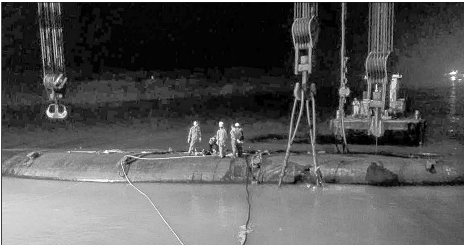
4日晚,救援人员为“东方之星”号扶正打捞工作做准备。