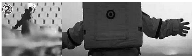
①、②:复旦大学校庆宣传片里许多镜头与东京大学宣传片十分相似。

复旦大学宣传片抄袭日本东京大学的余波还未平息,随后上线的中文版宣传片和校庆logo也都被扒出抄袭。