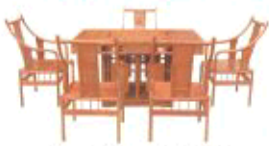
花梨木罗马茶桌6件套 市场价:4.1万 工厂价:1.58万

东阳“会六”红木家具郑重承诺:件件精品 货真价实 假一赔十 终生维修 抢到就升值!