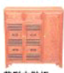
花梨木鞋柜 市场价:3.2万 工厂价:1.28万