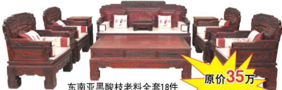
东南亚黑酸枝老料全套18件

现场有很多消费者是抱着半信半疑的心态来看看的,现场看到市场参考价在几十万的家具套餐真的可以用几万块钱就能买到家。如对用料有怀疑,现场就可以切出木屑来验证,有疑惑就不出手,看好了就直接提货回家,既不用担心造假,又不用担心看好的家具被换成假货,还有比这个更能保证质量和用料的办法吗?每一件都是真正的红木材料,做工精美绝伦,让您对产品的一切质疑都烟消云散,纷纷抢购。