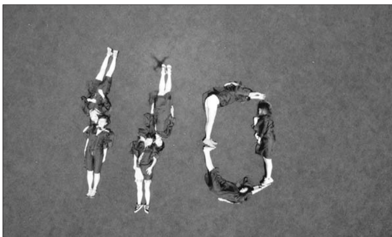
永远都记得小时候那句话,有困难打110找警察叔叔。

看过前天《今日烟台》的读者们,一定记得“城事”版报道的烟大学生航拍毕业照的事情。哈哈,将视角拉到高空,效果就是不一样。前天刊登了一张,今儿就来看看另外几张创意毕业照吧。