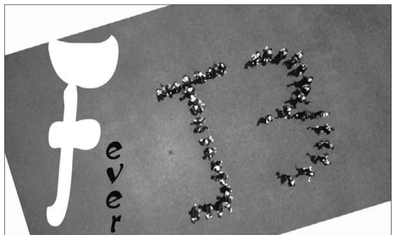
J3是这组毕业照拍摄者——计算机3班的班号。