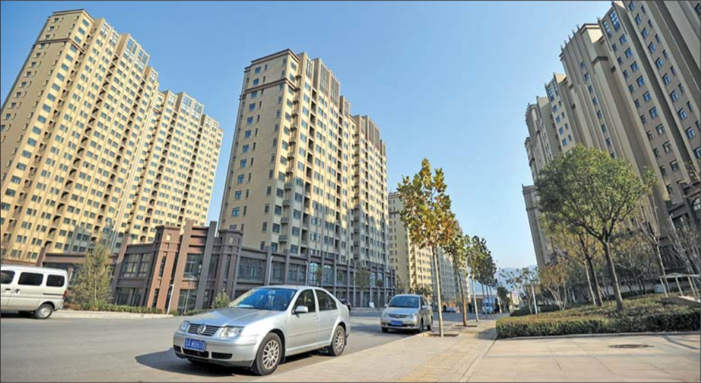
位于孟家水库附近的西蒋峪公租房去年11月开始入住。 本报记者 王媛 摄(资料片)

“公租房租赁合同期满不再续签的,应及时将户口迁往实际居住地。”工作人员提醒,目前房屋建设综合开发集团和物业公司协同工作,大约每天可为40户居民办理户口迁移初审工作。“如果一切顺利的话,从初审到办结,最快只需要一个星期。只要办理完手续,居民就可正常享受辖区适龄儿童入学、住户就医、老年人养老等服务。”