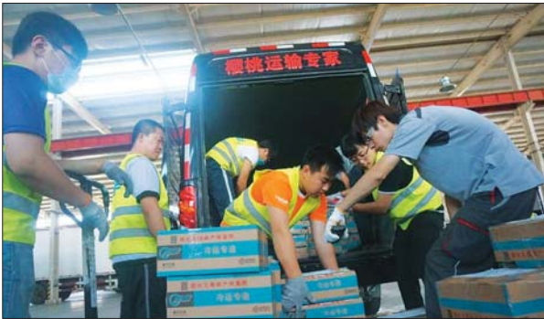
大樱桃季,顺丰工作人员每天都要加班加点发货。

员和运输上有所增加,在场地方面,烟台顺丰在原有黄务8000多平方米的分拣中心的基础上,今年为保障樱桃快件及时中转,在烟台福山清阳工业园新租近5000平方米专门场地用来处理樱桃快件,另公司在福山区新租用一冷库专门用来储存采购分拣大樱桃。同时公司在原黄务场地及新租场地共计投入使用22条装卸车半自动化分拣设备。 “截至6月17日,烟台顺丰共计发运樱桃5200余吨。”工作人员说,通过烟台顺丰发运樱桃产值达2.5亿余元。