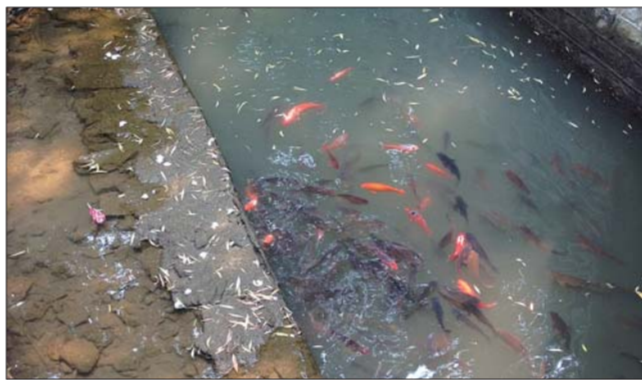
水量变小,游鱼聚集在河道内。