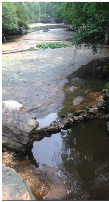
公园内泉影井已经见底。