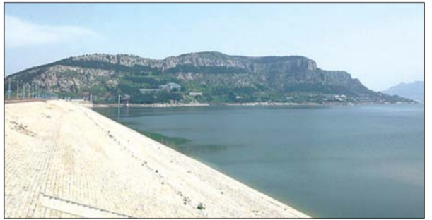
17日的卧虎山水库存水明显见少。

济南市水利局相关工作人员介绍,“回灌补源可以缓解地下水水位快速下滑的趋势,如果没有去年以来的回灌补源,趵突泉等泉群可能早已停喷。”由于最近遭遇高温、少雨,农业灌溉等多重不利因素的影响,回灌补源的效果较为有限,“实现水位的大幅反弹还是要靠有效降水。”