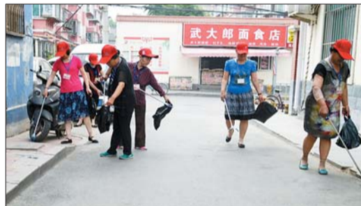
青龙街社区志愿者清扫路面垃圾。

目前创建国家卫生城市工作已经进入关键阶段,为此请广大市民继续响应市委、市政府的号召,以主人翁姿态投身到“创建卫生城市”活动中来,从自身做起,按照创卫标准要求进行整改。以文明市民的标准来严格要求自己,遵守公德,保持市容环境整洁,爱护公共设施,做到不乱摆摊点,不跨门槛经营,不乱堆乱建,不乱停乱放,不乱贴乱画,不乱倒垃圾,不随地吐痰,不随地大小便,不在公共场所和禁烟场所吸烟,自觉落实“门前三包”责任制,文明经营,坚决抵制不符合卫生标准的食品和生活用品,倡导健康文明的生活方式,用实际行动为“创建卫生城市”增光添彩。