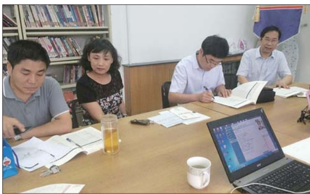
29日,山师大商学院老师们在QQ群解答疑惑。

本报高考薇课堂QQ群人数不断增加,总群(431676527)已满,为满足家长和考生的需求,1群(214733028),2群(460580933)正式开通。无论你在哪个群,我们都将为大家提供高质量的服务。