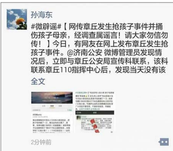
济南网警经过核实后,进行辟谣。