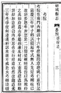
聊城县志中考院的记载。