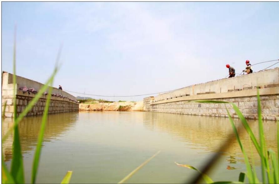
▲乳山滨海新区加快道路桥涵等民生工程建。(资料片)