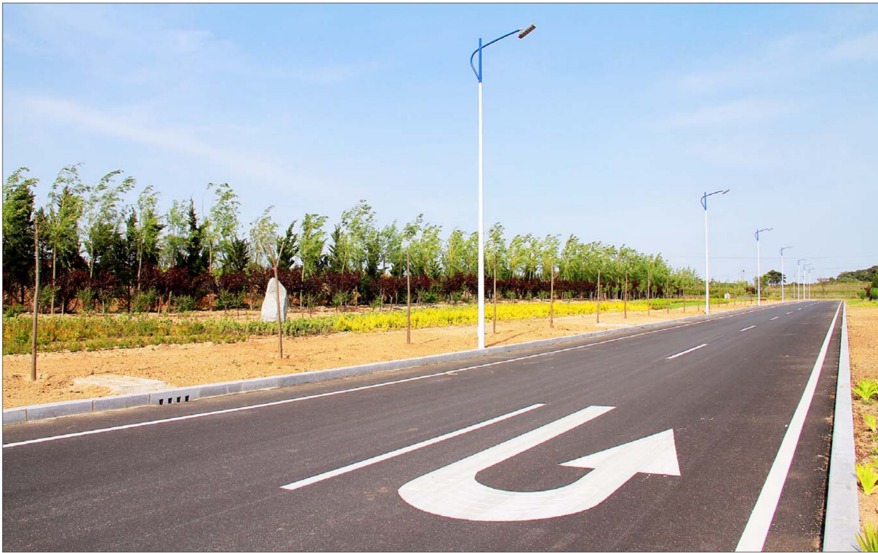
▲乳山滨海新区不断完善银滩等重点区域路网，建成了总里程195公里的“五纵二十横”交通网络。(资料片)

清理户外门头广告、广告牌，整治露天烧烤……生态环境的改善更让居民纷纷叫好。此外，滨海路停车场管理、进海岸带整治，也都让居民看在眼里，喜在心上。滨海新区今年投资2.1亿元用于海岸带整治与近海生态修复工程，加快安置地建设进程。各大道路的绿化档次也一步步提升。