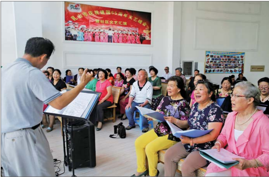
▲居民在乳山银滩益天社区活动中心排练歌曲。(资料片)