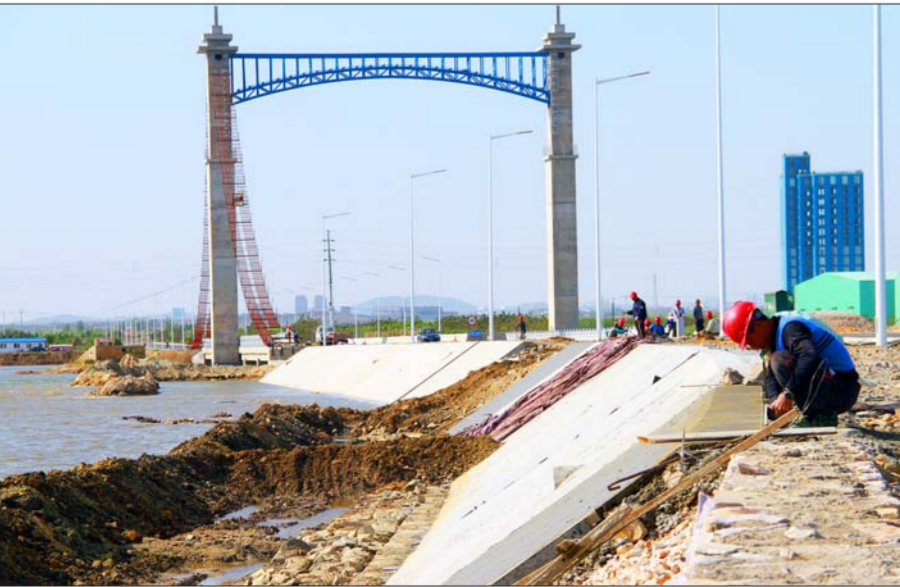
▲乳山银滩工作人员在修护岸堤。(资料片)

经过不断探索，乳山滨海新区已逐步建立起社区事务闭合处理、民情信息分级分类报送等一整套信息受