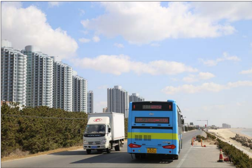
▲乳山滨海新区实施公交一体化后，新公交让银滩居民生活更便利。(资料片)