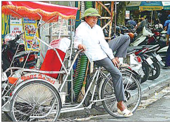
越南三轮车车夫在等待游客。