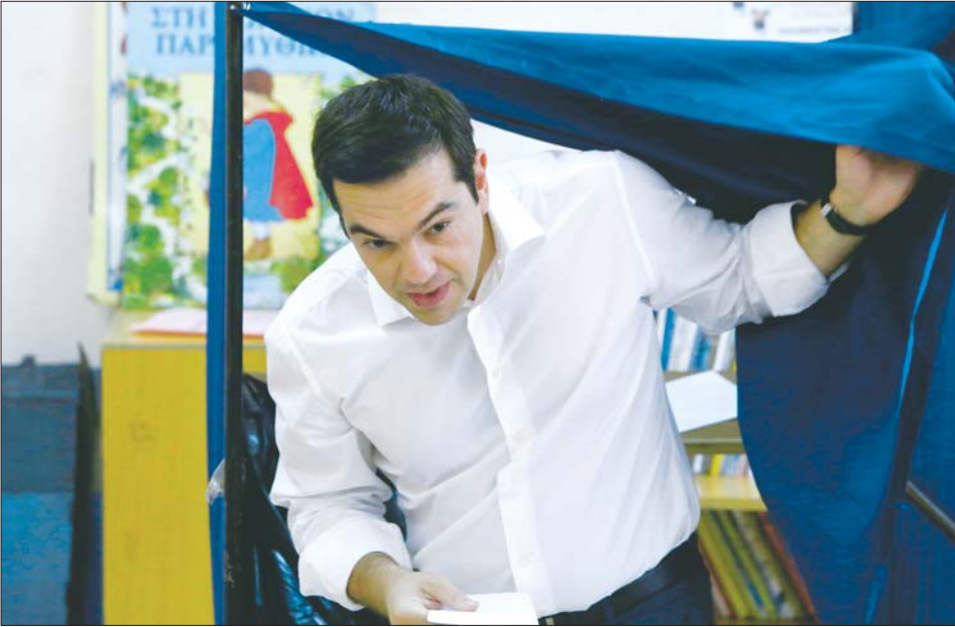
7月5日，在希腊雅典，希腊总理齐普拉斯参加投票。