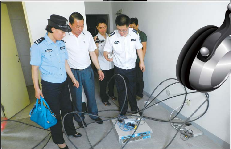
执法人员现场查处黑广播设备。

据了解,目前黑广播所使用的发射设备的技术标准低,到处都能买到。记者在网上就找到很多售卖广播发射机的店铺,分布在全国各地。常规的功率有5W至50W,售价几千元,有1000W