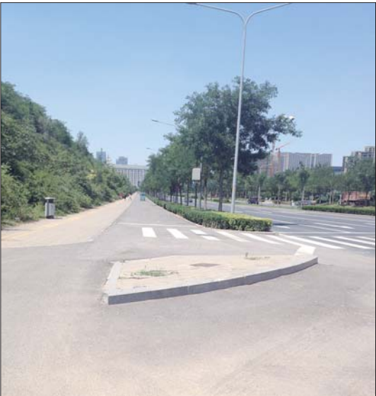
非机动车道上的凸起物就是“肇事者”。