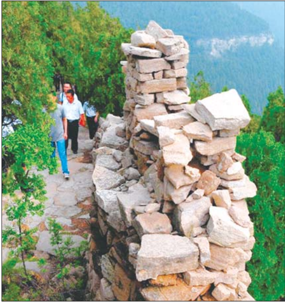
作为建成最早的长城，齐长城的每一块石头均有文化价值。

齐长城始建于春秋齐桓公时期，从初建到完成耗时约400年，因为建成时间最早，最古老，被称为世界长城建造的“原点”。它从我省西部黄河开始，沿泰沂山脉，逶迤618.9公里在青岛市黄岛区入海。堪称“饮黄河、跨泰山、卧黄海、兴齐鲁”，既是一道独具特色的综合性自然人文景观，又是齐鲁居民不可多得的精神信仰财富。