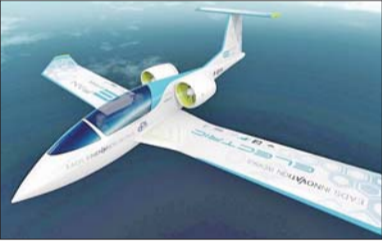
E-Fan电动飞机此前曾在法国波尔多“电动飞机日”活动中亮相。(资料片)