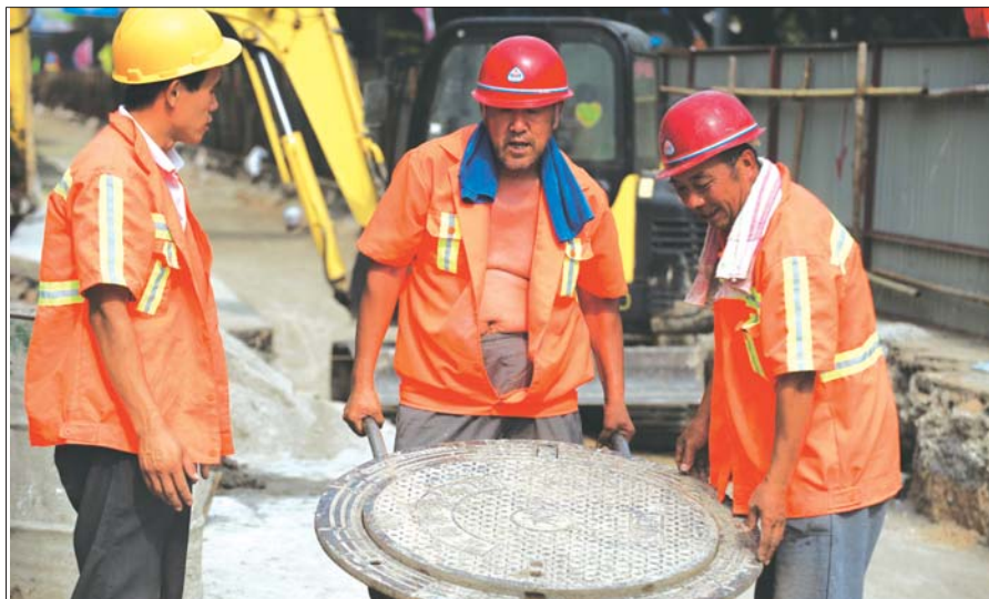
13日下午3点左右,济南市解放路一工地,工人在高温中操劳。本报记者 周青先 摄

15日夜间到16日白天,鲁西北和鲁南地区天气多云间阴局部有雷雨或阵雨,其他地区天气多云。雷雨地区雷雨时阵风7~8级。最高气温:内陆地区33°C左右,沿海地区28°C左右。