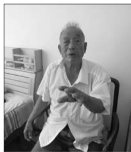
牛推官庄一牛姓老人讲述抗战时期他见到的“兵工厂”。