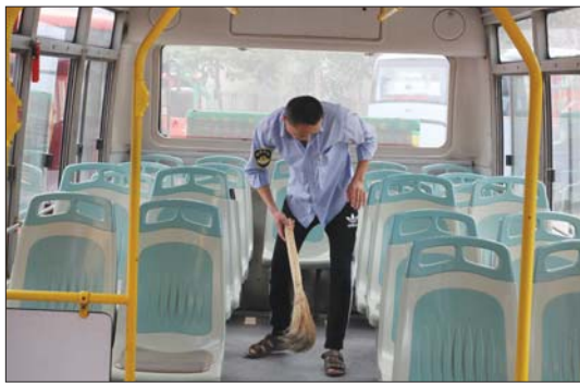
每趟出车前都要打扫一遍车厢里边的卫生。