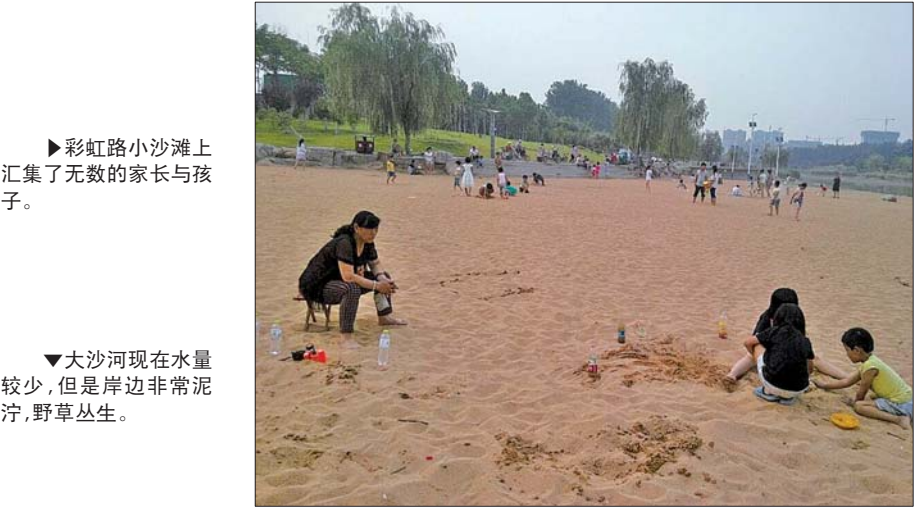
►彩虹路小沙滩上汇集了无数的家长与孩子。

集了很多的家长与小孩。孩子在家长的带领下搭建城堡，玩泥巴、乘坐充气筏。记者发现，硕大的沙滩上却没有任何的防护措施，只有彩虹路边小沙滩的岩石上设立了“水深危险，请勿游泳”的提示牌，好在小沙滩与水域连接处较为平缓。家长和孩子乘坐的收费充气船上，工作人员也准备了救生衣。若在游玩的家长或孩子发生溺水情况时，收费充气船的工作人员应该会进行抢救。