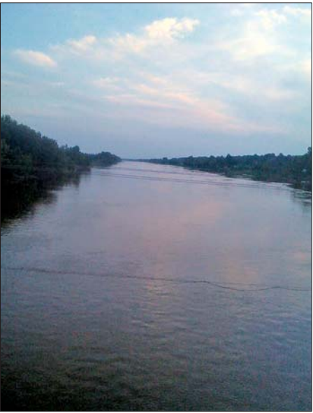
▲丰水期的徒骇河，还是很令人生畏的。