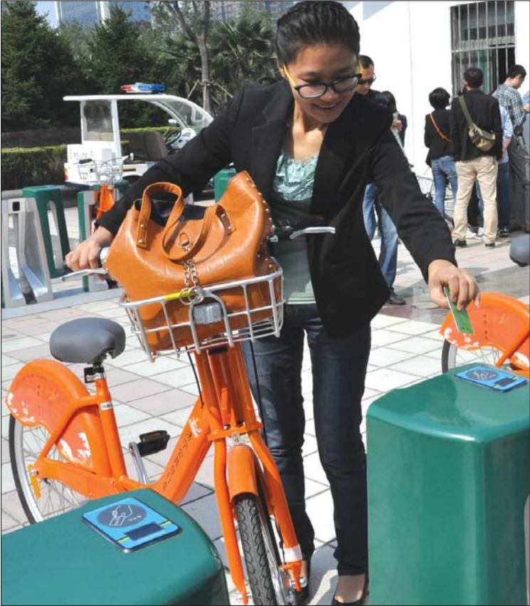
一位市民正在刷卡借车(资料图)

县区的公共自行车系统建立后,将与济宁城区公共自行车卡通借通还。届时,市民手持一张卡,就可以在兖州、梁山、邹城等县区刷卡借车。