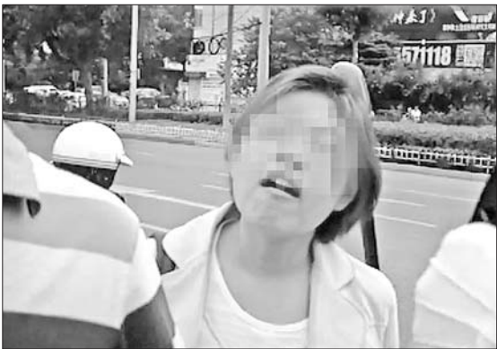
女子多次指责交警执法是“没事找事”。 视频截图

本报济南7月25日讯(记者 张泰来) 24日,天桥交警在查处一辆无牌摩托车时,后座女乘客听闻扣车处罚突然发飙,连续指责交警是“狗屁执法,吃饱了撑的,没事找事”。在民警强制扣车时,该女子竟脚踹、推打在场的四五名交警,交警动用了警用器械才控制了场面。