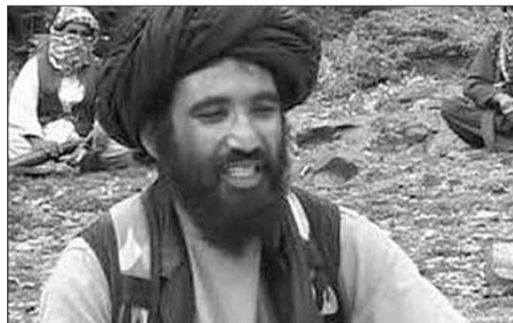
阿赫塔尔·穆罕默德·曼苏尔 (资料片)