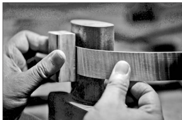
小提琴的侧板需要加热后一点点地折弯。