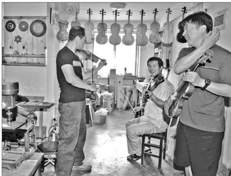
工作室是琴友们相聚的地方,这里经常飘出悠扬的琴声。

特别声明:本次赠阅纯属公益性质,全过程不收取任何费用,如有违规请打电话举报。由于此次活动中领人群较多,请使用有效电话拨打,如遇占线我们会第一时间给您回拨。