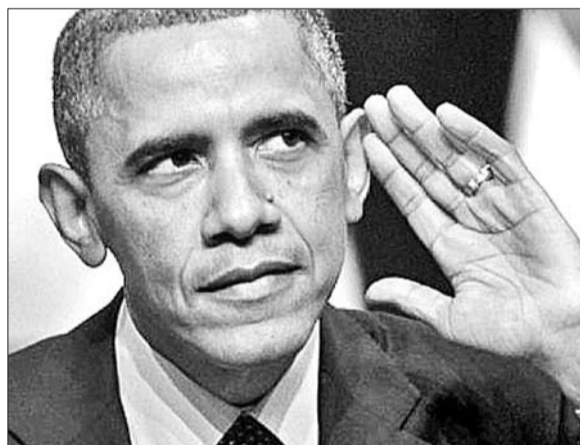
美国总统奥巴马(资料片)

“‘如果属实,极为遗憾’。明摆着一直在窃听。”一名网民写道。“用一句‘极为遗憾’就完事了。这样的领导层,日本不会出问题吧?”另一名网民说。