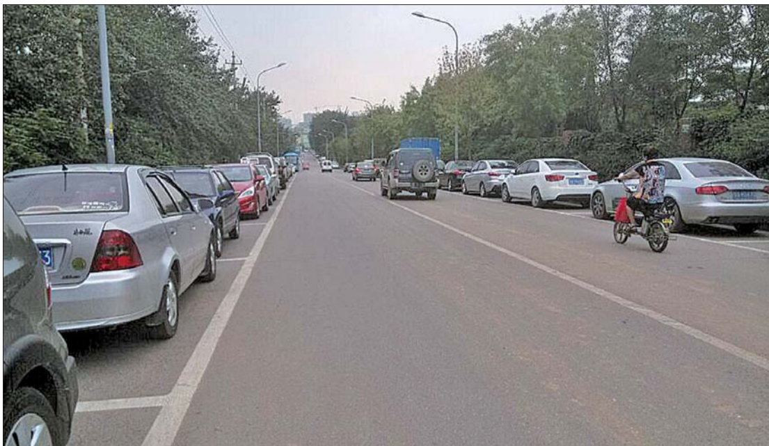
堤口庄北路两侧都划上了车位,机动车和非机动车在中间两条车道上混行,安全隐患很大。

对于原有停车单位前期的投入,翟占安表示,目前已经有了初步方案,但一些细节还未最终敲定。按照这一方案,原有单位在建设时安装监控等方面的投资,也是为了保障停车场的正常运行、保障停车秩序。如果接下来停车公司接手,或将从事停车收益当中拿出一部分来补贴给原有停车单位。