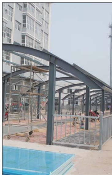
滨魏二区市场自行车车棚正在紧张施工，建成后可容纳1000余辆自行车。