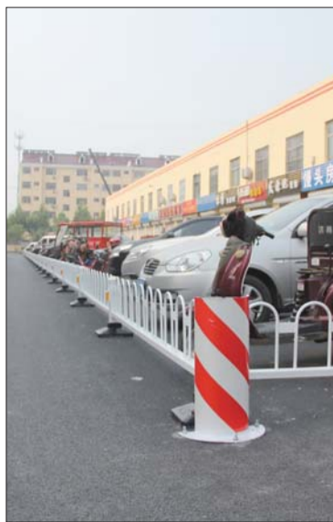
秦皇河果蔬市场西侧设置停车栏，有效防止车辆乱停乱放。