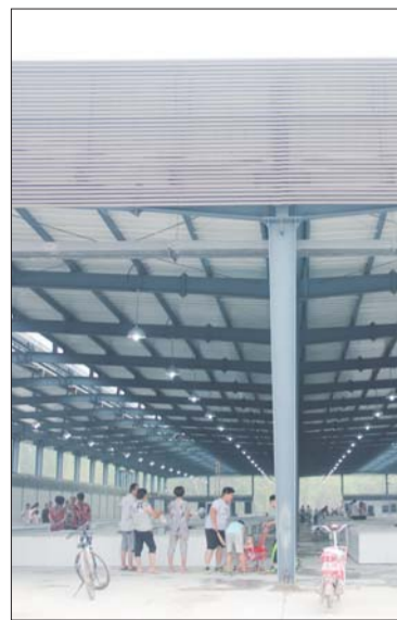
马坊市场已达到交工条件，只待业户入驻。