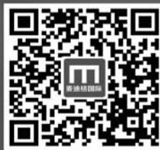
扫描二维码 查看十余万成功矫治案例