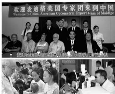
欢迎麦迪格美国专家团来到中国 Welcome to China, American Optometric Expert team of Maledige

针对笔者关于麦迪格塑形组合安全性及效果稳定性的提问，专家们也给出了专业的解答，他们告诉笔者：“麦迪格塑形组合是一种物理矫治方法，不会对眼睛及角膜带来任何伤害，他的安全性甚至高于普通隐形眼镜。对于长期效果来说，麦迪格塑形组合是专门针对中国学生用眼量大