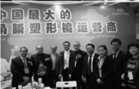
中国最大的角膜塑形镜运营商