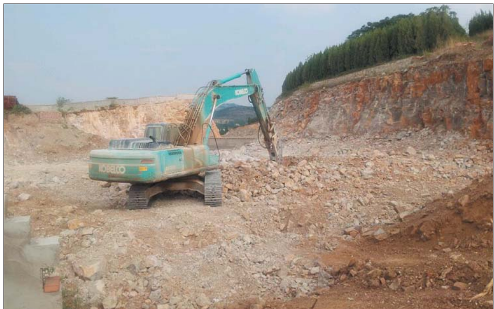
7月28日下午,一台大型机器在山体西侧作业。

本报8月6日讯(见习记者于梅) 近日,有读者向本报反映,在平安南路北汝村附近的山上(齐鲁汽车生活广场西北侧)有人开山采石,破坏山体,现场尘土飞扬,施工时不仅噪音刺耳,环境混乱。