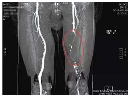
红色圈注区域狭窄闭塞。