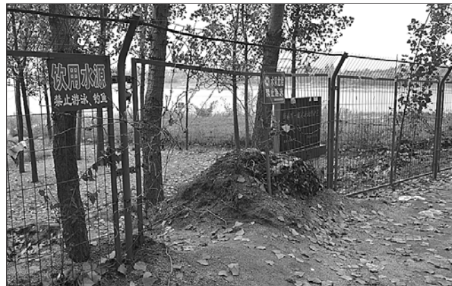
防护网被人开了个洞。