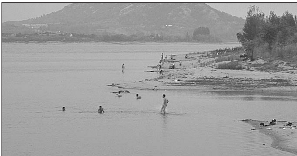
不少人在湖里裸泳。

管理负主要责任。灌溉局没有执法权,可以联合环保局一起执法。他们之前也搞过不少联合执法行动,清理过湖里的网箱。