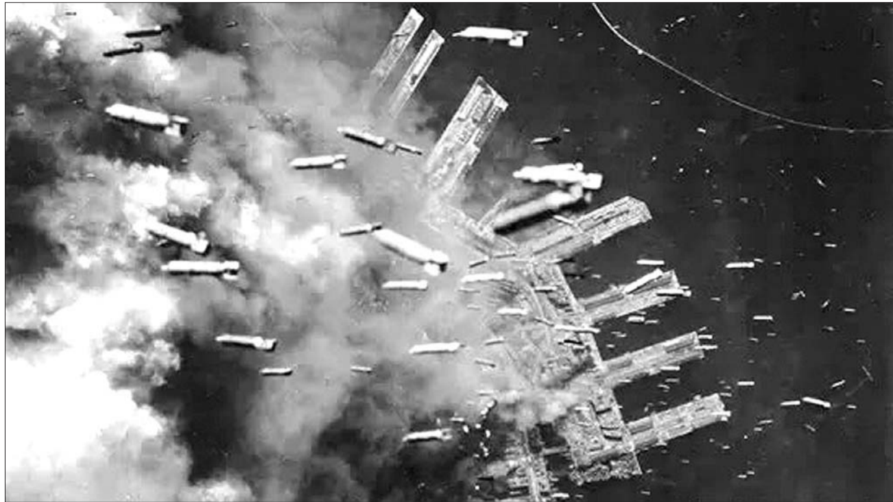
1945年6月4日,美军轰炸神户港口。

与海上封锁同时进行的,还有规模惊人的常规轰炸。美军对日本的大规模轰炸,早在1944年末突破“绝对防御圈”后就开始了。柯蒂斯·李梅少将在主导对日轰炸事宜后,注意到日本防空系统已瘫痪的事实和普通建筑大多采用木质、竹制结构的特性,因而制定了夜间低空投掷燃烧弹的新战术,这种战术史称“李梅火攻”,给日本人留下了比