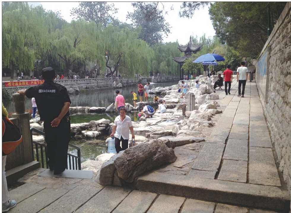
在保安看守下,白石泉畔游客不能久待。