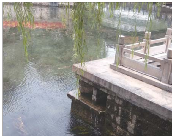
7日的玛瑙泉泉水满池,向外溢出。