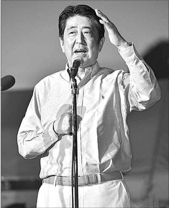
8月13日,安倍在其老家山口县参加关门海峡烟火大会时进行即兴演讲。

据日本共同社报道,日本政府消息人士透露,首相安倍晋三将于14日下午5点(北京时间4点)召开决定战后70周年谈话的临时内阁会议,并于6点(北京时间5点)起在首相官邸举行记者会,安倍将在会上公布其准备已久的“安倍谈话”。对于这份谈话要说什么,连日来日本国内与国际各方没少操心,然而正如美国媒体所支招的那样,与其模棱两可两面不讨好,诚心认错恐怕更容易得到邻国的原谅。