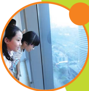
◀从高处看看美丽的济南

我的家乡济南是个美丽的城市，风景如画，自古以来就以“家家泉水户户垂杨”著称。泉城济南，最著名的当然是泉水，济南有七十二名泉，而趵突泉则是七十二名泉之首，被誉为“天下第一泉”，因此远近闻名。