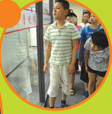
▼这个编辑叔叔好帅哦