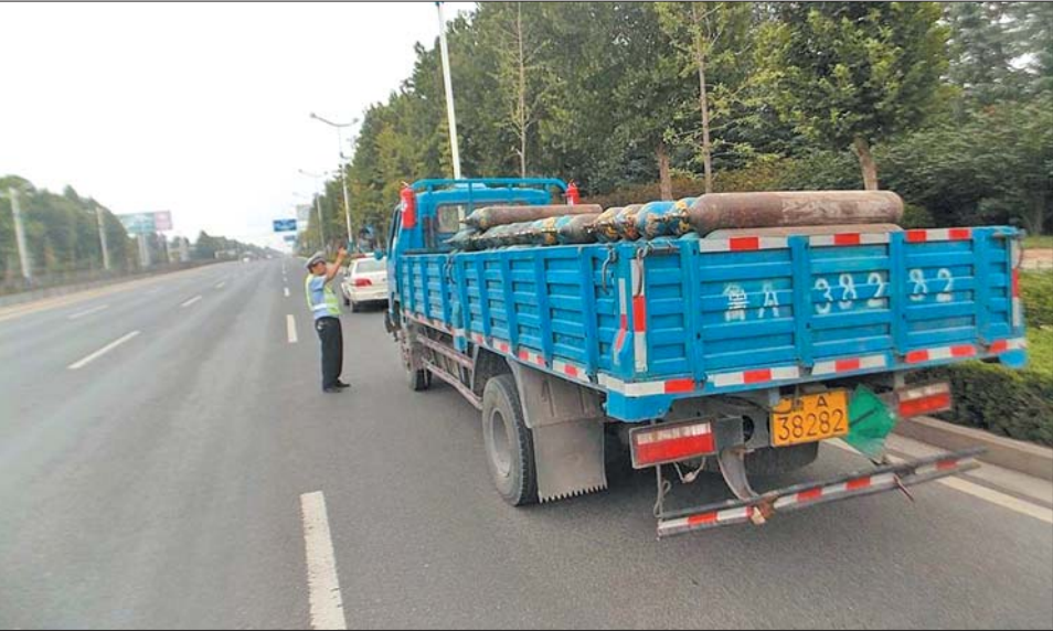
长清交警走上街头,严查危化品运输车辆,严防交通安全隐患。