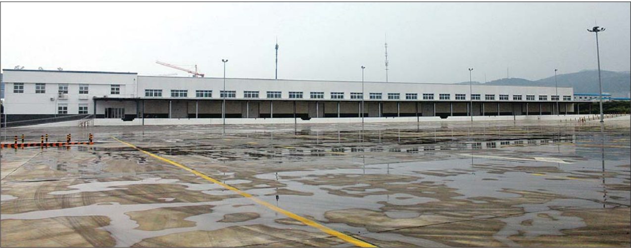
口岸功能区及海关监管场站已经建设完成。本报记者 修从涛 摄

长期以来，省内企业从青岛港进出口货物是惟一便利的选择。但是距离青岛港较远的省中西部企业，因长距离的拖送集装箱及较高的通关成本，无形中推高了企业的生产成本，同时也制约了我省中西部外向型经济的发展。好消息是，经过济南综合保税区(后称综保区)和青岛港以及海关部门的联合推动，济南综保区与青岛港有望在本月底实现真正意义上的“区港联动”。届时，在济南综保区即可办理原先需在青岛港办理的通关手续，可为进出口企业尤其是省中西部进出口企业节省大笔运输成本。